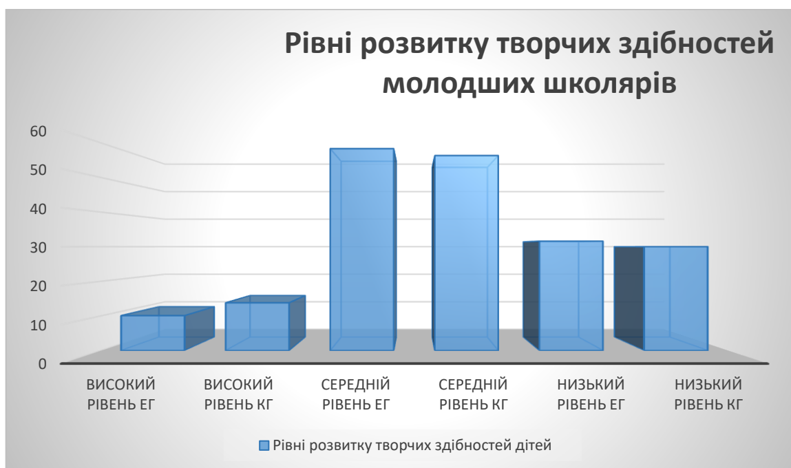
Рис.2.2 – Діаграма рівнів розвитку творчих здібностей молодших школярів

За результатами експериментальних даних на рисунку 2.2 представлена діаграма рівнів розвитку творчих здібностей молодших школярів.