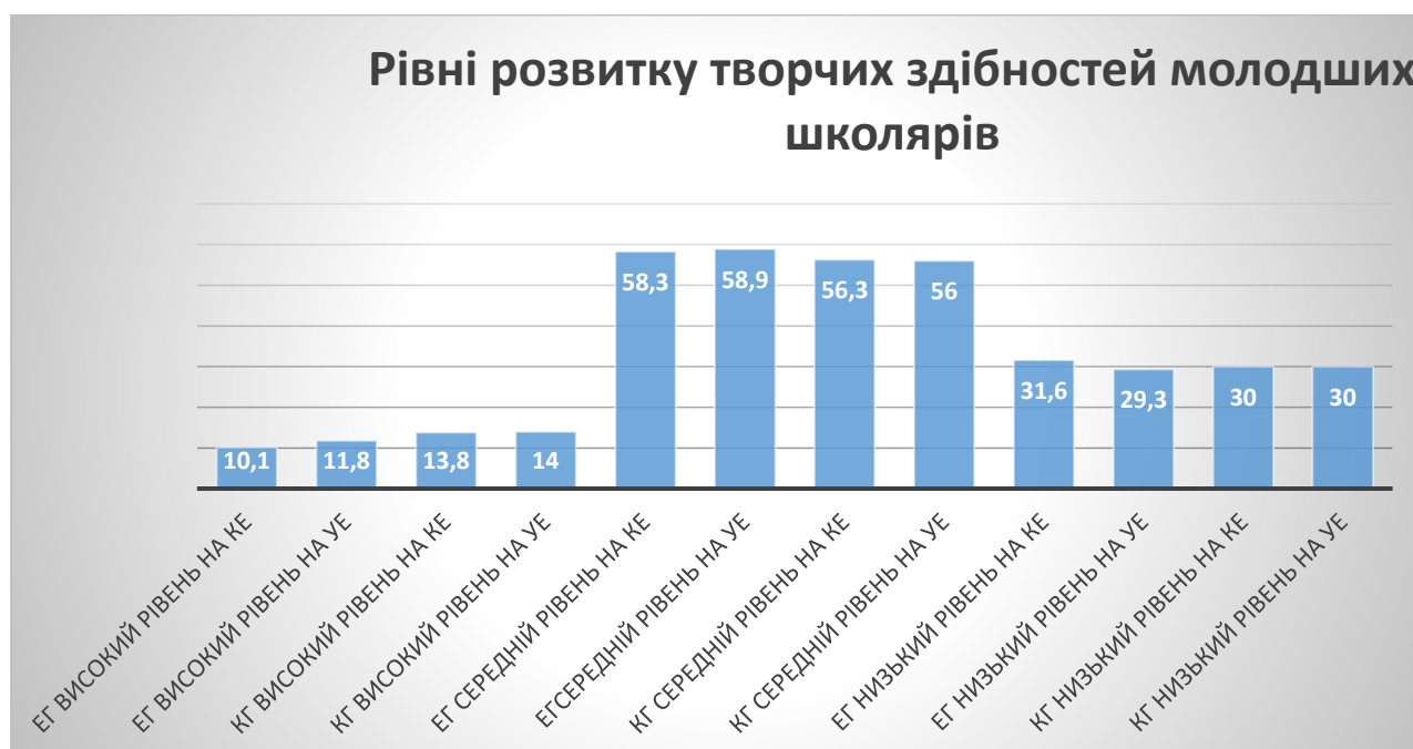
Рис.2.3 – Порівняльна характеристика рівнів розвитку творчих здібностей молодших школярів за результатами констатувального та узагальнюючого етапів експерименту

За результатами експериментальних даних на рисунку 2.3 представлена порівняльна характеристика рівнів розвитку творчих здібностей молодших школярів за результатами констатувального та узагальнюючого етапів експерименту.